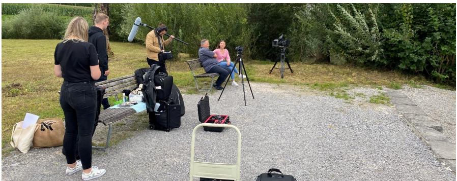
Filmaufnahmen für den Imagefilm am Seeufer bei Rapperswil-Jona.

Eine Arbeitsgruppe kümmert sich um die Realisierung eines Imagefilms. Die Mitglieder finalisierten das Manuskript und arbeiteten das Drehbuch/das Storyboard aus. Die Produktionsfirma Gallus Media AG aus St. Gallen machte die Landschaftsaufnahmen und absolvierte die Dreharbeiten mit den SchauspielerInnen am Seeufer bei Rapperswil-Jona. Der Imagefilm zeigt die Leistungen und Pflichten der Ortsgemeinden auf. Premiere feiert dieser an der Generalversammlung 2022.