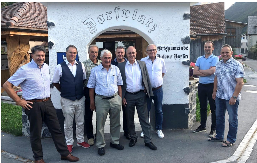
Der Vorstand kam im August 2020 in Valens zu einer Sitzung zusammen.